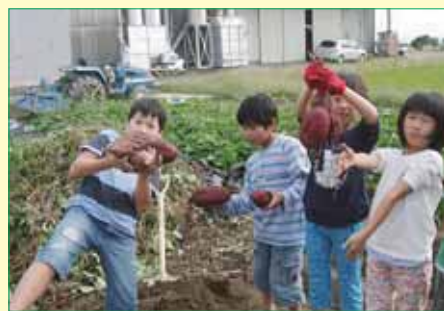
手にいっぱいさつまいも

10月12日(水)、さつまいもを収穫しました。全部おやつになります。大学いもが一番人気です。みんなの笑顔がとても素敵ですね。