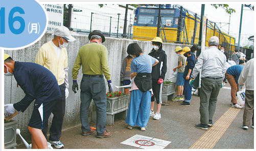
JR 能登川駅東口 能登川南小学校 5・6 年生