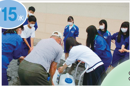
JR 能登川駅西口 能登川中学校生