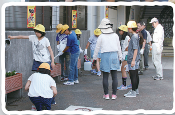
6月4日(月) JR 能登川駅東口 能登川南小学校6年生が担当。