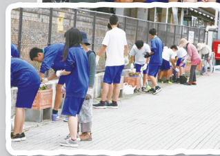
6月12日(火) JR 能登川駅西口 能登川中学校生徒会が担当。