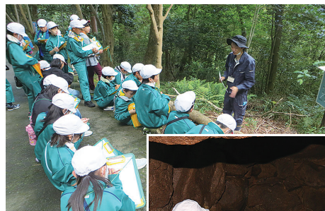
埋蔵文化財センター職員による古墳の説明