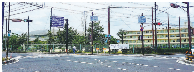
現在 [1972(昭和47)年 信号設置]