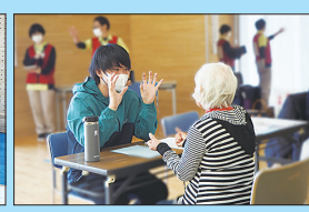
健康相談コーナー