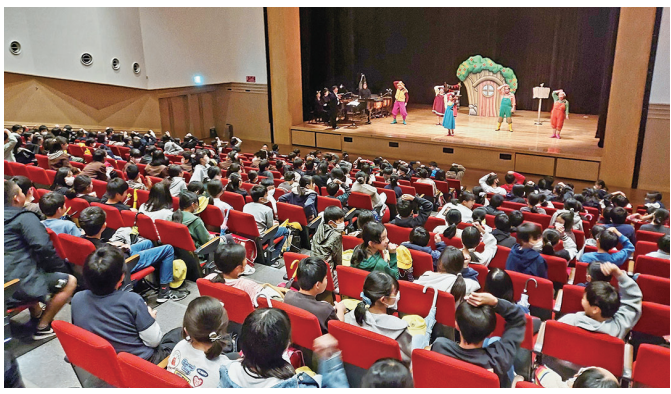
子ども向けにとてもわかりやすく、親しみやすい公演でした。 子どもたちの笑顔はいいですね。ニコニコ「笑顔力」です。