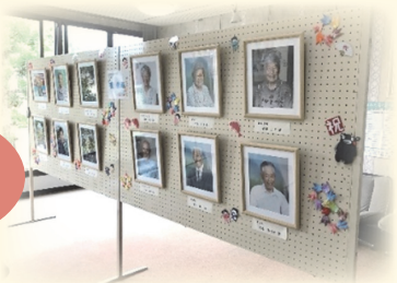
令和2年度掲額の様子 ※写真展の会場は、あらためてお知らせいたします。