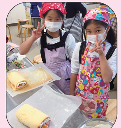
くると上手に巻けました