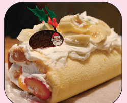
お家に帰ってデコレーションしました