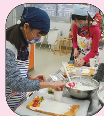
ふわふわに焼きあがったスポンジにクリームとフルーツをのせます

初めてロールケーキ作りをする参加者も多く、「難しかったけど楽しかった！」「家でもまた作りたい」と喜んでいました。