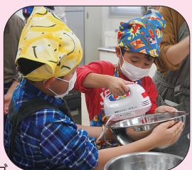
ペアで協力してメレンゲを作ります