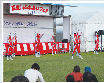
赤レンジャイショー