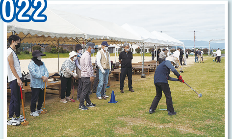
変則グラウンドゴルフ対決

秋晴れのもと、自治会の方々や大勢の老若男女がさまざまな軽スポーツを楽しみました。