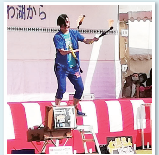
ステージパフォーマンス