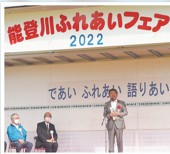
開 会 式