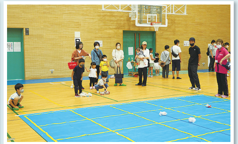
ニュースポーツ体験