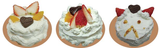
ステキな手作りケーキが完成しました

粟見出在家町で収穫された「魚のゆりかご水田米」の米粉を使ったケーキ作りをしました。