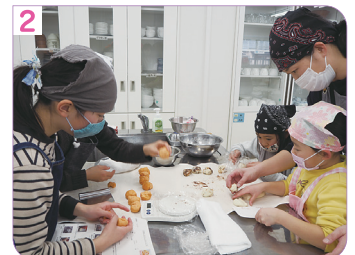
生地を均等に分け、転がすように丸めて形をきれいに整えます。