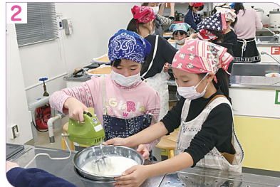
2人で協力して作ります♪