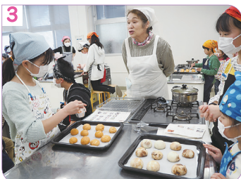
焼き色を“つやピカ”にするために、 卵液を塗ります。