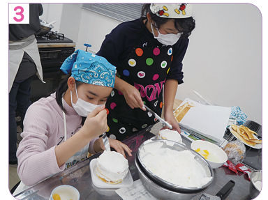
ケーキのデコレーションに挑戦！ 自分好みにアレンジして、 オンリーワンのケーキを作ります(^-^)