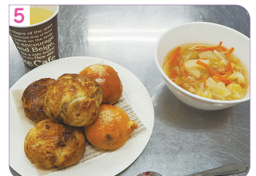
ふっくらおいしい手作りパンと野菜たっぷり コンソメスープの完成です♪