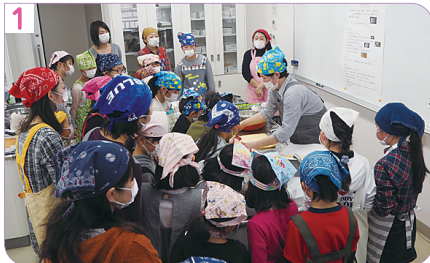
先生にお手本を見せてもらいます！