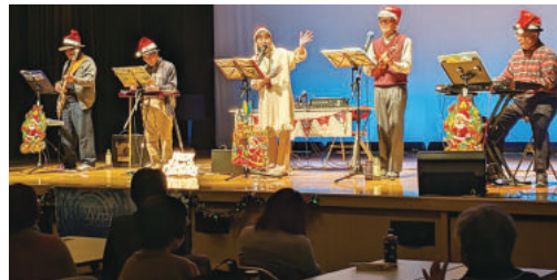
クリスマスコンサート