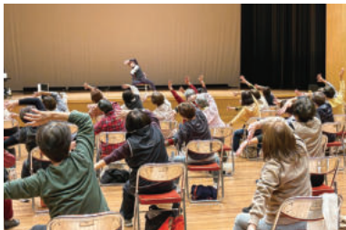
姿勢改善エクササイズ