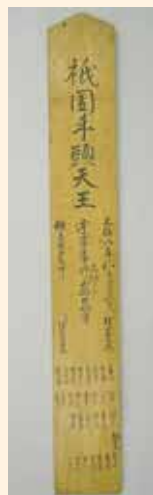
(元禄八年牛頭天王社の棟札 大濱神社蔵)