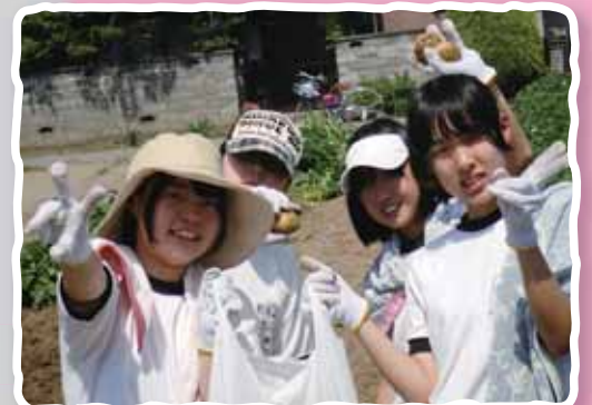
じゃがいも掘りを体験しました

栗見出在家町の11軒のお宅に、千葉県船橋市立前原中学校3年D組の生徒38名が修学旅行の一環として農家民泊体験に来られました。