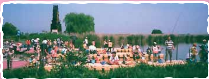
7kgの外來魚が釣れました