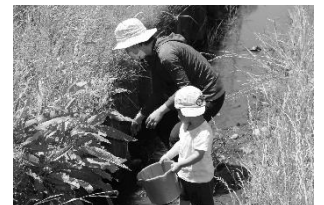
生き物調査 今年の活動の様子

※新型コロナウイルス感染症の拡大防止のため、催し物は中止・延期になる場合があります。