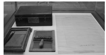
堀井謄写版1号機と謄写版原紙 (ガリ版伝承館蔵)