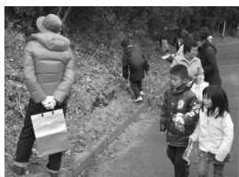
昨年の活動の様子