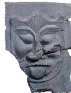
小八木廃寺出土 「鬼面文瓦」

帝塚山大学附属博物館が所蔵する東アジア各地の古瓦や埴仏(せんぶつ)と東近江市内の法堂寺廃寺跡(佐野町)等からの出土遺物を展示し、東近江の古代寺院の源流を探ります。