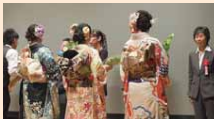
恩師への花束贈呈