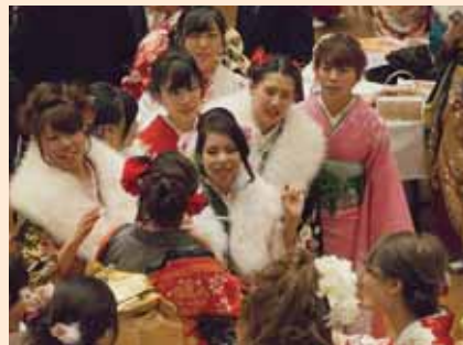
久しぶりの友人との再会