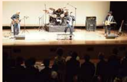
W-D4 スペシャルライブ