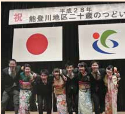
二十歳のつどい実行委員