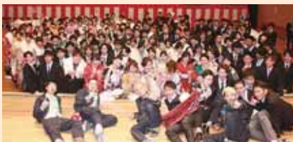
W-D4 メンバーと記念撮影