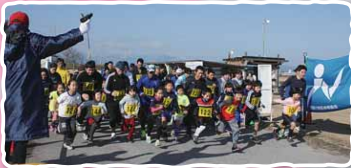
小学3年生以下の親子ジョギングの部