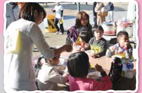
豚汁でほっと一息