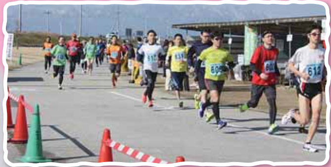
高校生～一般男子の部