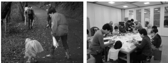
昨年度の活動の様子