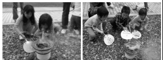
昨年度の活動の様子