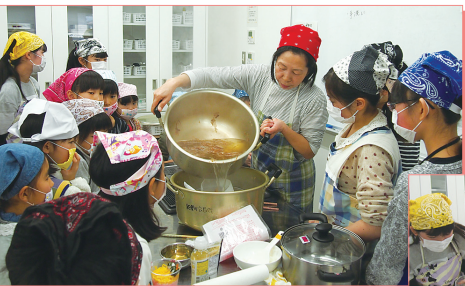
昆布とかつおの合わせ出汁