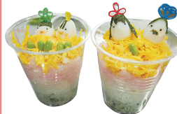
うずら卵のお雛様とお内裏様

ひな祭りにちなんだカップ寿司を作りました。和食の基本となる『出汁』についても学び、色や香りの違いを感じました。