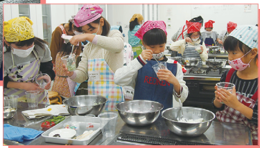
3色のすし飯を重ねます