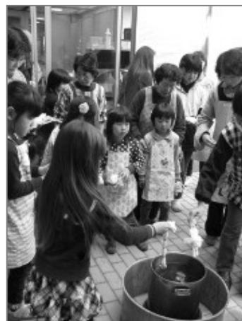
昨年の活動の様子

身近すぎて気がつかない植物の魅力を再発見していただくきっかけになればと思います。