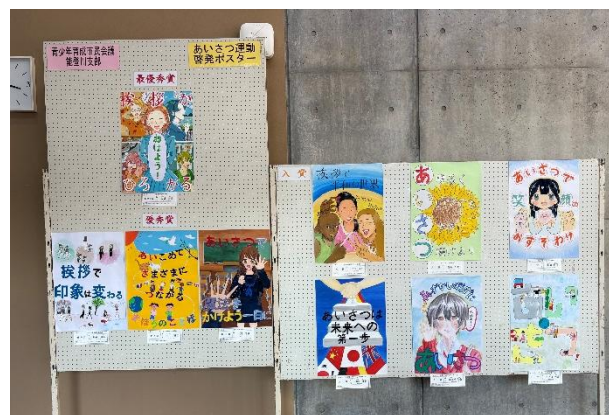
—あいさつ運動啓発ポスター—