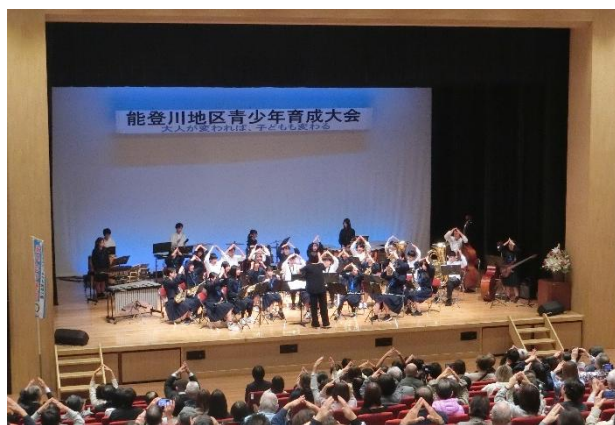
—演奏会— (能都川中学校吹奏楽部)