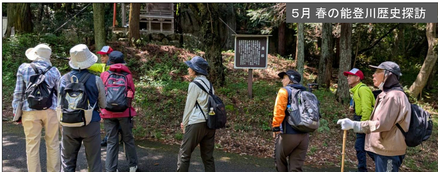
5月 春の能登川歴史探訪